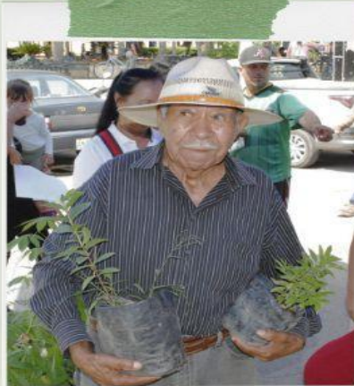
Adopta un árbol 2025