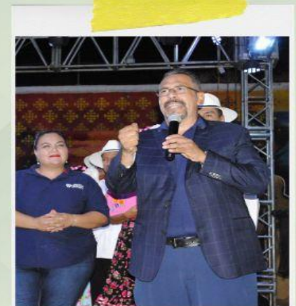
Evento 42 aniversario