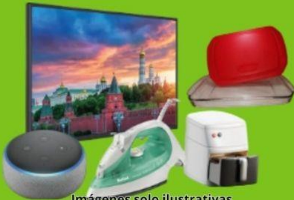
Imágenes solo ilustrativas