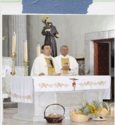
Misa del 42 aniversario