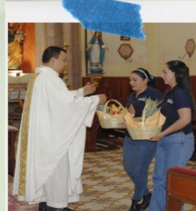
Misa del 42 aniversario