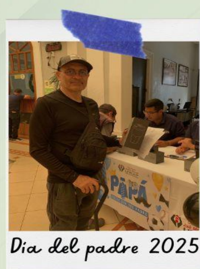
Día del padre 2025