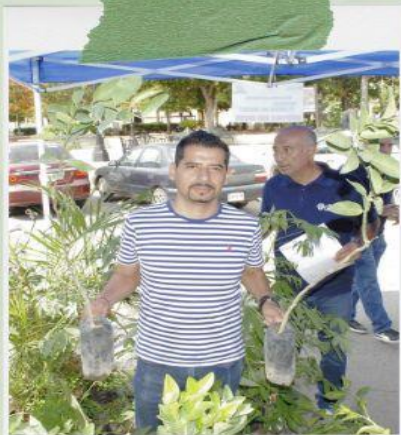
Adopta un árbol 2025