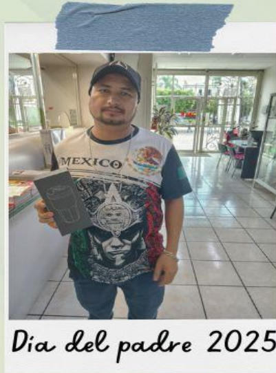
Día del padre 2025