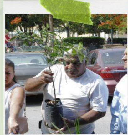
Adopta un árbol 2025