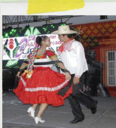
Evento 42 aniversario