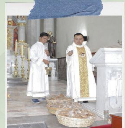
Misa del 42 aniversario