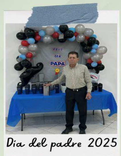
Día del padre 2025