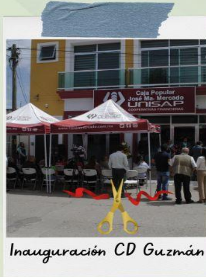
Inauguración CD Guzmán