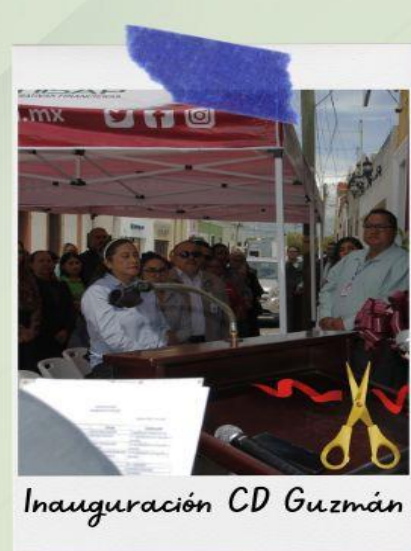
Inauguración CD Guzmán