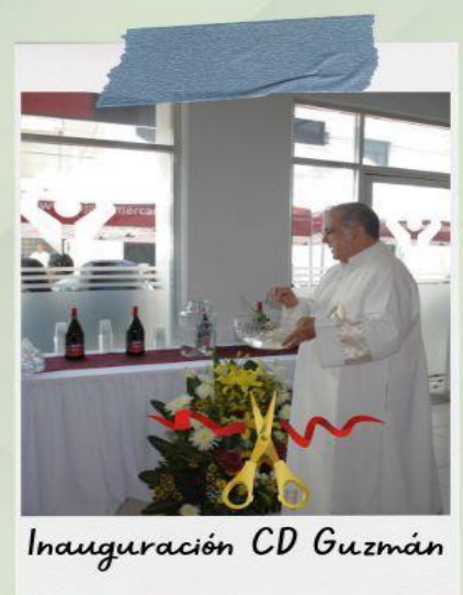
Inauguración CD Guzmán