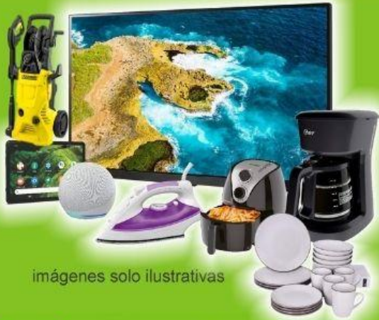
imágenes solo ilustrativas